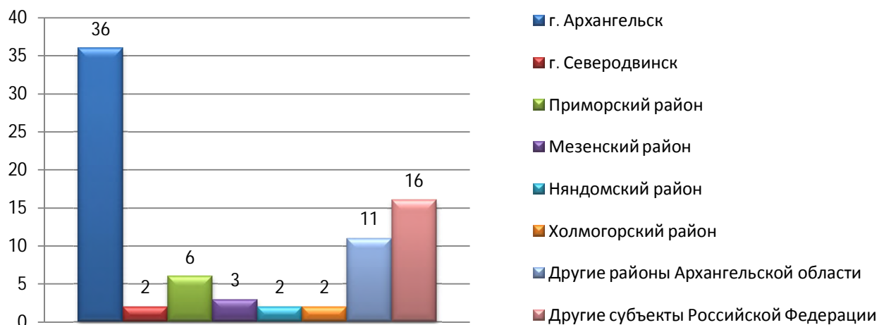
Рисунок 2. Распределение обращений по территориальному признаку

48 обращений поступили в областное Собрание без указания места жительства заявителя.