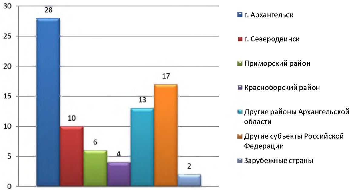
Рисунок 2. Распределение обращений по территориальному признаку

Вопросы, изложенные в обращениях граждан, отражены в таблице 3 в соответствии с Тематическим классификатором обращений граждан Российской Федерации, иностранных граждан, лиц без гражданства, объединений граждан, в том числе юридических лиц, Управления Президента Российской Федерации по работе с обращениями граждан и организаций.