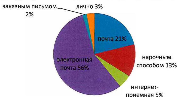
Рисунок 2. Структура обращений по способу доставки

Письменные обращения поступали в 2020 году непосредственно от авторов обращений, через ФГУП «Почта России», электронную почту областного Собрания (duma@aosd.ru), официальный сайт областного Собрания посредством интерактивной страницы «Интернет-приемная», а также при помощи курьера или посредника (нарочным способом).