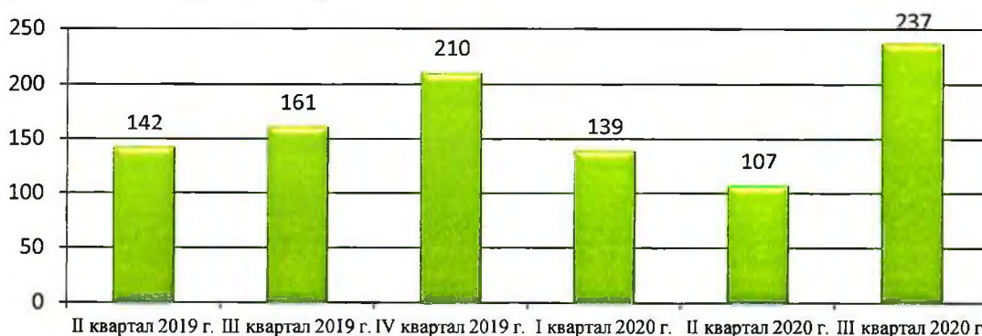
Рисунок 1. Динамика поступления обращений

По сравнению с предыдущими отчетными периодами количество обращений увеличилось, при этом наибольшее количество обращений поступило в июле 2020 года (139 обращений, что составило 59 процентов от общего числа обращений).