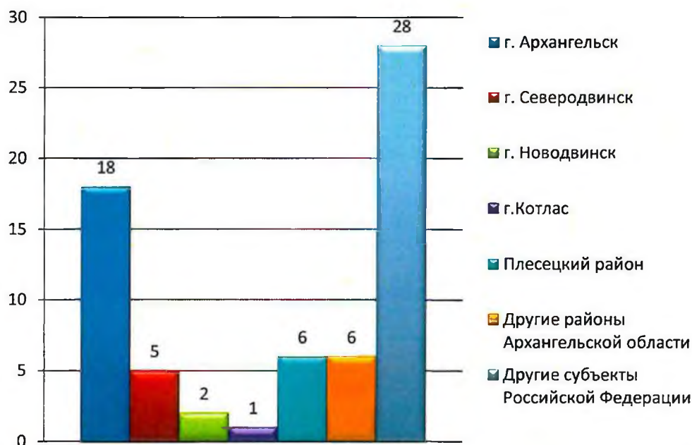
Рисунок 3. Распределение обращений по территориальному признаку

(Архангельск, Новодвинск, Северодвинск и Котлас), 5 муниципальных районов Архангельской области (Вельский, Котласский, Приморский, Плесецкий и Холмогорский районы), 11 субъектов Российской Федерации (Москва, Санкт-Петербург, Калининградская, Рязанская, Волгоградская, Московская и Челябинская области, Краснодарский край, Республика Башкортостан, Республика Татарстан, Ханты-Мансийский автономный округ-Югра).