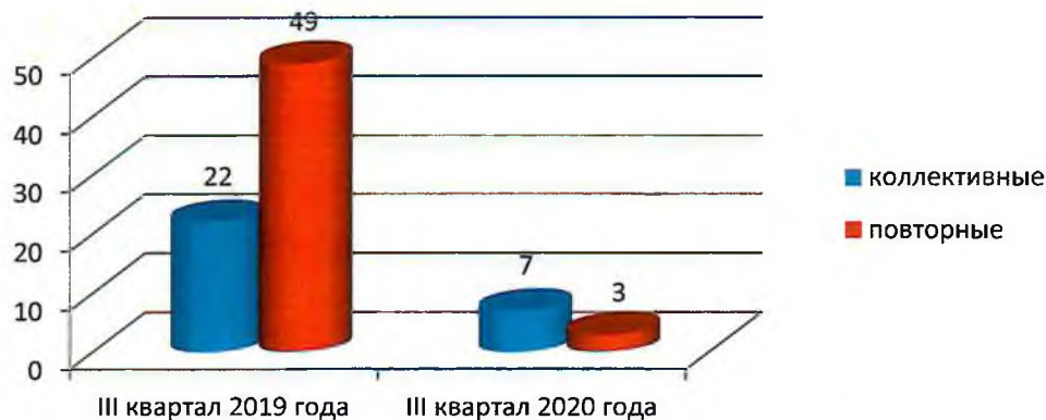
Рисунок 2. Сравнительная характеристика обращений

Из всего объема поступивших в третьем квартале 2020 года заявлений, предложений и жалоб число коллективных обращений составило три процента, а повторных – один процент. По сравнению с аналогичным периодом 2019 года количество коллективных и повторных обращений уменьшилось на 68 и 94 процента соответственно. Анонимных обращений в областное Собрание в отчетном периоде не поступало.