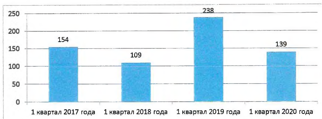
Рисунок 1. Динамика поступления обращений

Динамика поступления обращений граждан за аналогичные периоды предыдущих годов представлена на рисунке 1.