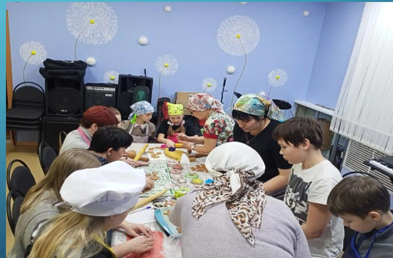
Мастер - класс