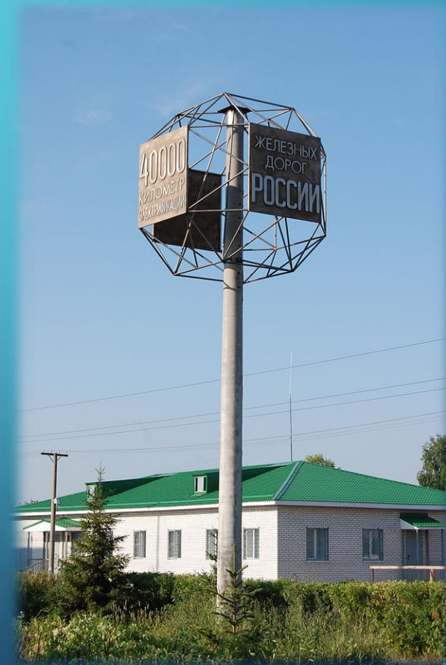
Памятник «40 000 километр электрификации железных дорог России»