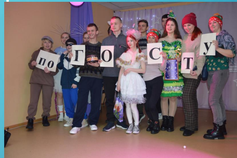
Вместе мы команда