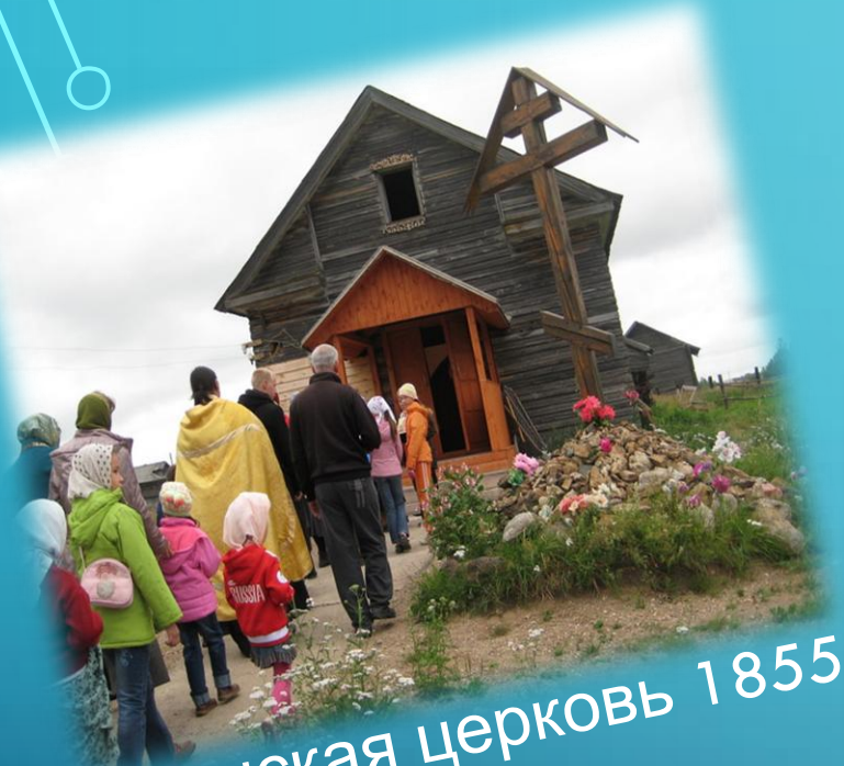
Ильинская церковь 1855