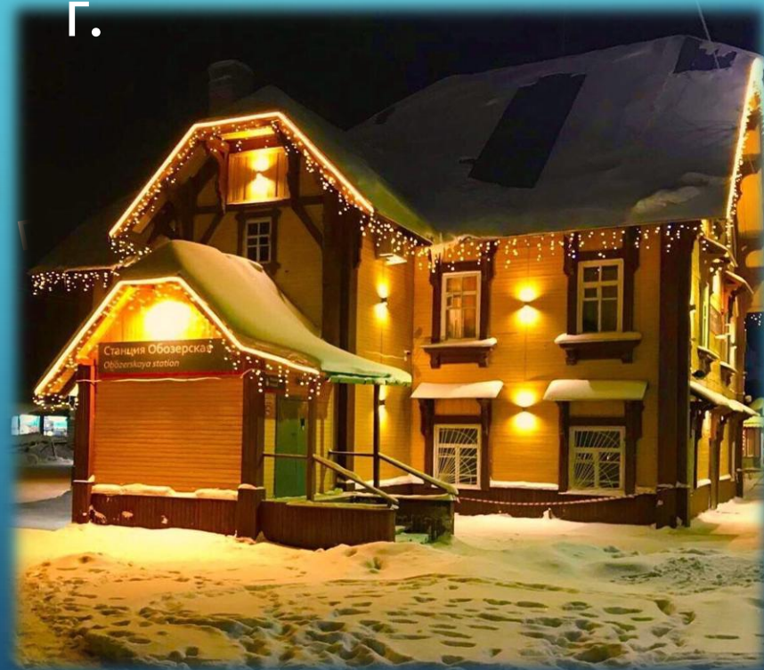
Здание вокзала 1896 г.