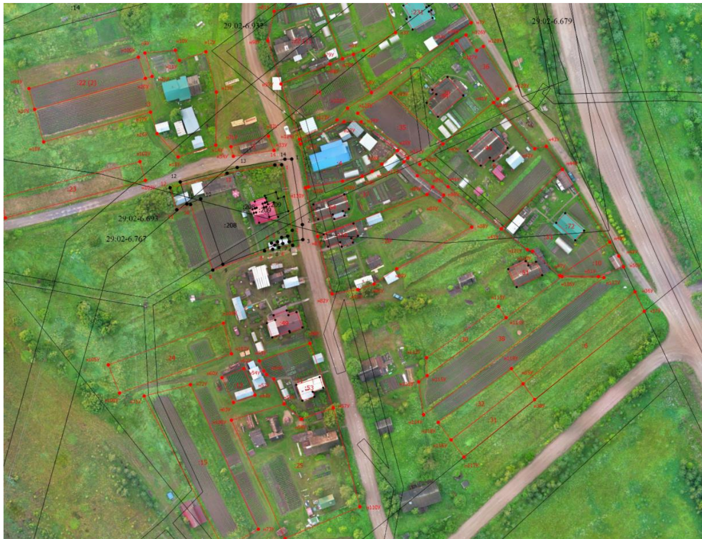
Рисунок 1- Схема границ земельных участков из карта-плана территории в кадастровом квартале 29:02:010401 в Верхнетоемском округе.