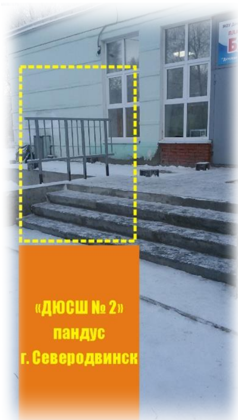
«ДЮСШ № 2» пандус г. Северодвинск

«Социальная поддержка граждан в Архангельской области (2013 – 2024 годы)» государственная программа Архангельской области