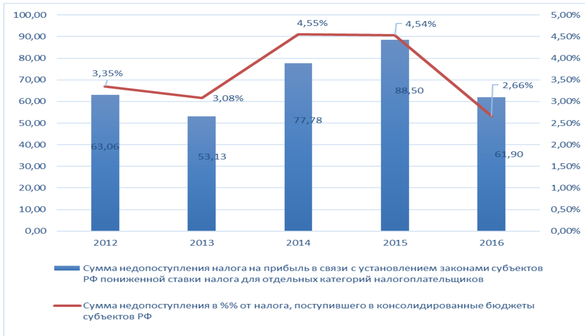
Потери консолидированных бюджетов субъектов РФ от применения пониженной налоговой ставки